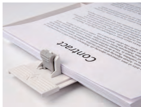
copy shopy, tisková oddělení...